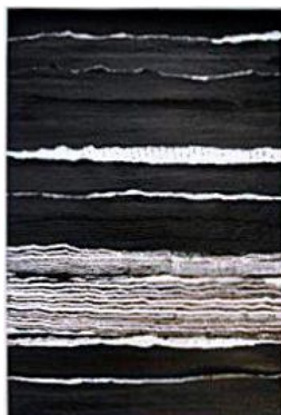
Mathilde Poulanges, composition

Le livre conforte sa place de matière première dans l'œuvre de Mathilde Poulanges. Produite en masse, l'objet livre a une vie de plus en plus courte, parfois voué au pilon dès publication.