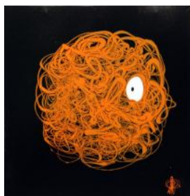
Mathilde Poulanges, peinture

L'aspect déstructuré et ultra-aléatoire prend le dessus. L'artiste fait couler la peinture sur la toile, créant un amas de fils qui vont prendre la forme d'êtres étranges et inédits aux contours calligraphiques.