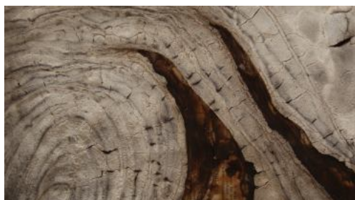
Mathilde Poulanges, détail de composition