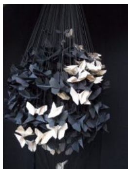
Mathilde Poulanges, installation

Le papier fait irruption dans l'œuvre de Mathilde Poulanges. Plié, suivant les codes de l'origami, ce sera la naissance d'une multitude de papillons associés en envolées.