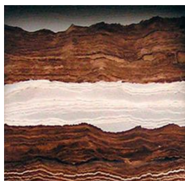
Mathilde Poulanges, composition

Outre son amour du livre, Mathilde Poulanges soulève la question de la destruction de celui-ci.