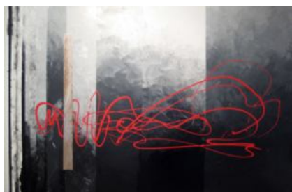
Mathilde Poulanges, peinture

Mathilde Poulanges s'est d'abord orientée vers la peinture : Des toiles colorées où apparaissent, telles des fractures, des lignes colorées qui petit à petit vont s'étaler, se déformer jusqu'à créer des imbroglios de fils de peinture.